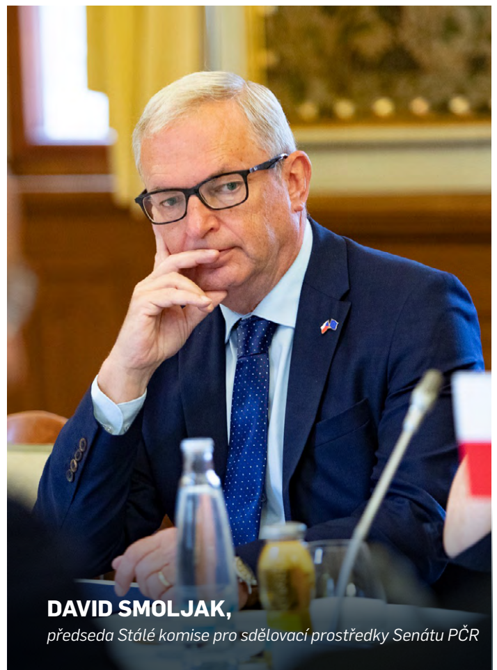
DAVID SMOLJAK, předseda Stálé komise pro sdělovací prostředky Senátu PČR

Nejúčinnějším legislativním nástrojem v boji proti nezákonnému obsahu v on-line prostředí tak zůstává Akt o digitálních