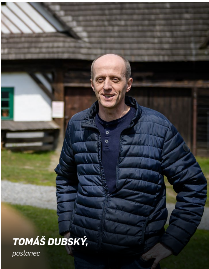
TOMÁŠ DUBSKÝ, poslanec

V posledních dnech zažíváme řadu zemědělských protestů, a to nejen u nás v České republice, ale v celé řadě evropských zemí. Kdo a proti čemu vlastně protestuje? Každá země má své specifické problémy, ale jedno společné protesty přeci jenom mají. Jsou tím výhrady k nastavení Společné zemědělské politiky EU. Je opravdu vše tak špatné, jak je nám to podsouváno?